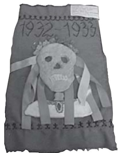
«Та нехай собі як знають Божеволіють, конають, – Нам своє робить».

Выбрать Тычину для оратории по Голодомору – надо было очень постараться. «Та нехай собі як знають Божеволіють, конають, – Нам своє робить».