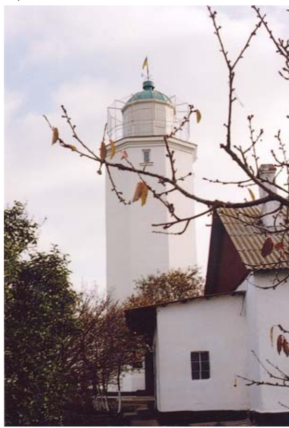
Севастополь – Одесса

На обратном пути ехали мимо начального или конечного пункта паромной переправы в Ильичевске. Здесь загрузились суда танками для Грузии перед известным конфликтом на Кавказе. В автобусе стало тихо. До окраины Одессы. Вот так в Одессе виделся Севастополь. А в Севастополе мне кажется, будто я из Одессы и не уезжал.